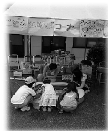
(昨年実施した第1回ふきいちの様)