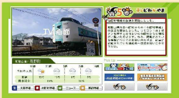
テレビ和歌山データ放送 TOP 画面