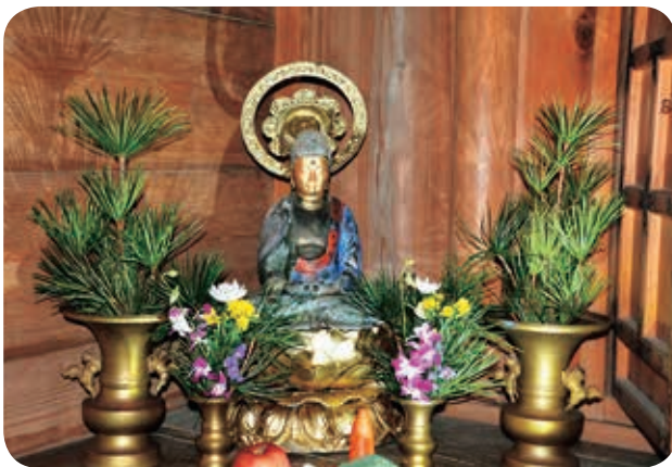
花坂観音堂に納められたレプリカの仏像

6年前の花坂観音堂での盗難被害のように、近年、地域のお堂に奉られている仏像等の盗難被害が多く発生しています。各地域で守られてきた仏像が盗難等の被害にあわないよう、十分注意してください。