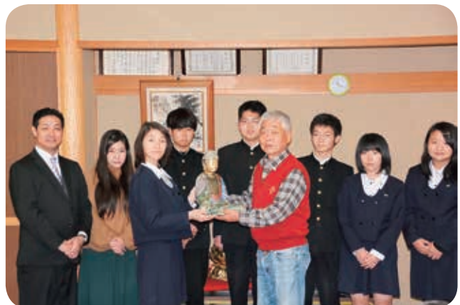
レプリカが花坂地区へ納められる様子