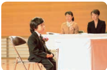
花坂小学校入学式