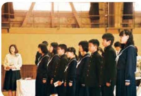
高野山中学校入学式