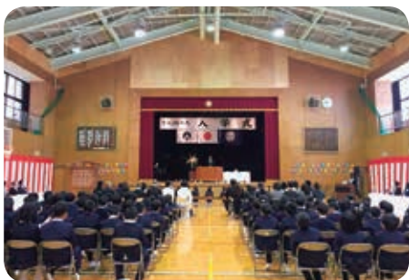
高野山小学校入学式

4月9日に高野山小学校では14名(男8名、女6名)、花坂小学校で男子1名が入学しました。4月10日に高野山中学校で入学式が行われ、8名(男3名、女5名)の生徒が入学しました。