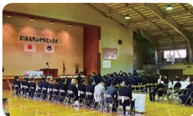
▲高野山中中学校入学式