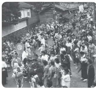
かつての青葉祭渡御の様子

宗祖降誕会法会は、大正三年には行われていたという記録があり、大正一五年に初めて、「青葉まつり」という文字があらわ