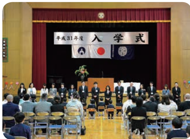
▲高野山小学校入学式

4月8日に高野山小学校では15名（男8名、女7名）、花坂小学校で男の子が2名入学しました。4月9日に高野山中中学校で入学式が行われ14名（男10名、女4名）が入学しました。