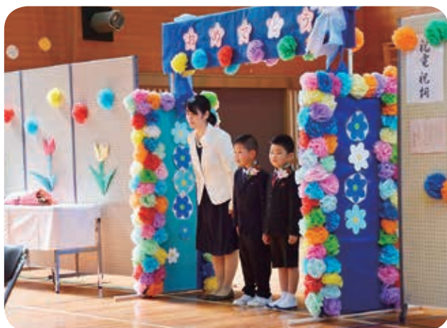
▲花坂小学校入学式