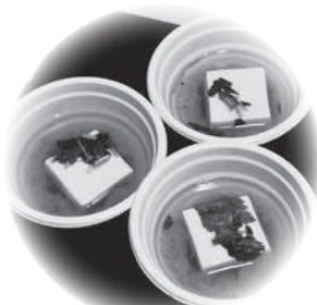
【食のおもてなし】連合婦人会、食生活改善推進協議会の皆さん