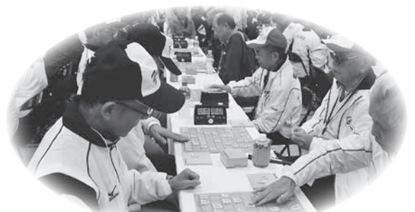
【将棋競技大会】団体優勝：兵庫県チーム