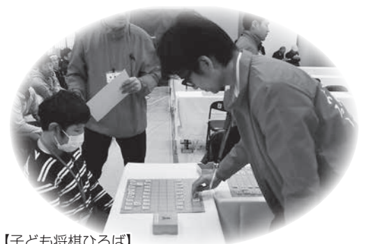
【子ども将棋ひろば】プロから指導を受ける子どもたち