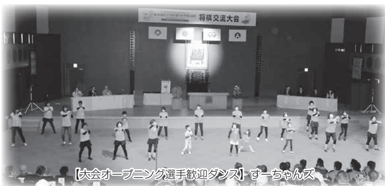
【大会オープニング選手歓迎ダンス】すーちゃんズ

これもひとえに様々な形でご協力いただきました町内各種団体・事業所様、多くの町民の皆様のご尽力の賜物であり、ここに厚くお礼申し上げます。