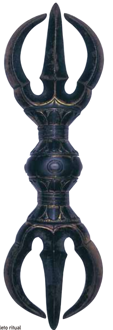
Sankosho Objeto o amuleto ritual utilizado por los monjes durante el culto en los templos budistas.