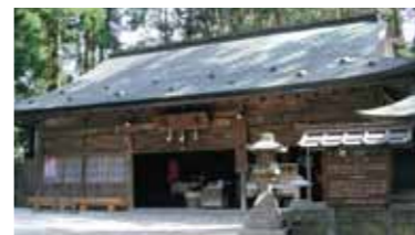
女人堂 Nyonin-do Hall

三代将軍家光が20年の歳月を費やし寛永20年(1643)建立された。右が東照宮家康霊屋、左が二代将軍秀忠霊屋で江戸時代初期の代表的な建造物。日光東照宮とは比較しがたい規模ながら廟飾は、黄金色に燦然と輝き、隅々まで細緻な技法がつくされている。