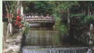
御廟橋 Gobyonohashi Bridge

一の橋から弘法大師御廟までの約2kmの参道の両側には、樹齢数百年の杉の大樹とともに歴史に名を残す諸大名などの20万基を超える墓碑や供養塔が立ち並んでいる。老杉から差し神々しい光に浮かび上がる苔むした墓石群は永い歴史を感じさせる。