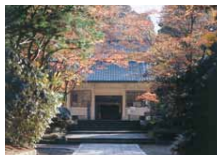
霊宝館 Reihokan Museum

高野山の総門で、宝永2年(1705)に再建された。高さ25.1mの重層の楼門で、両脇に安置する金剛力士は、江戸時代の仏師康意、運長による大作である。