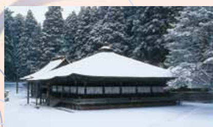
御影堂 Mie-do Hall

弘法大師空海の持仏堂、念誦堂で、真如親王筆の大師の御影をお祀りしている。現在の建物は、弘化4年(1847)に再建された。緩やかな屋根の勾配と深い軒を持つ優雅なお堂である。