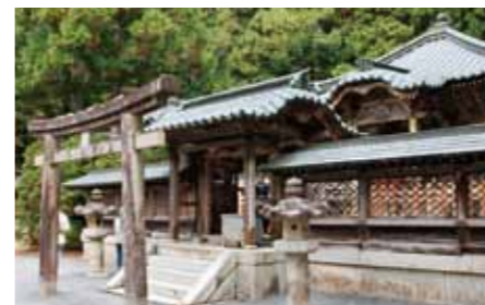
徳川家霊台 (重要文化財) Tokugawa Mausoleum

三代将軍家光が20年の歳月を費やし寛永20年(1643)建立された。右が東照宮家康霊屋、左が二代将軍秀忠霊屋で江戸時代初期の代表的な建造物。日光東照宮とは比較しがたい規模ながら廟飾は、黄金色に燦然と輝き、隅々まで細緻な技法がつくされている。