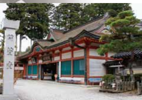
苺萱堂 Karukaya-do Hall

高野山真言宗の総本山で全国に約3600ヶ寺の末寺を有する。山上のほぼ中央にあり、弘法大師空海が開創した当時は、高野山全域を金剛峯寺と称した。現在の金剛峯寺は、文禄2年(1593)豊臣秀吉が亡母の菩提を供養するために木食応上人に命じて建立した青巖寺・興山寺を明治2年(1869)に合併し、総本山金剛峯寺と改称した。