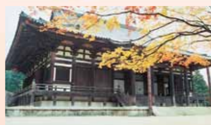
金堂 Kon-do Hall

弘法大師空海の持仏堂、念誦堂で、真如親王筆の大師の御影をお祀りしている。現在の建物は、弘化4年(1847)に再建された。緩やかな屋根の勾配と深い軒を持つ優雅なお堂である。