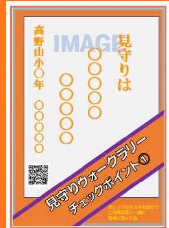
チェックポイント例