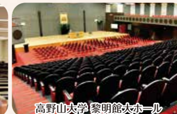
高野山大学 黎明館大ホール