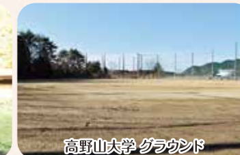
高野山大学 グラウンド