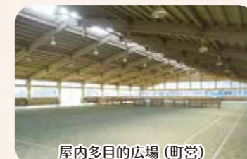
屋内多目的広場(町営)