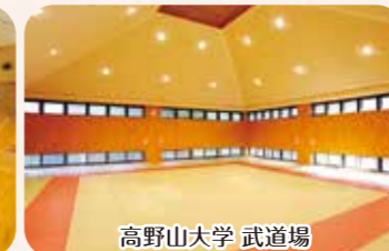
高野山大学 武道場