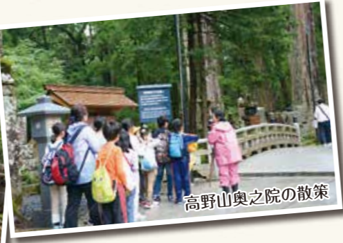
高野山奥之院の散策