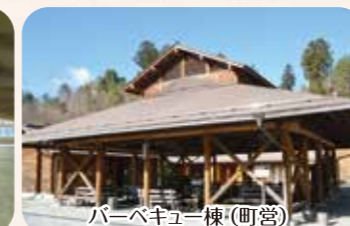
バーベキュー棟(町営)