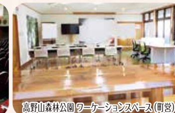
高野山森林公園 ワークショップベース(町営)

他にもさまざまな施設がありますので、目的や人数に合わせてご案内いたします。詳しくはお問い合わせください。