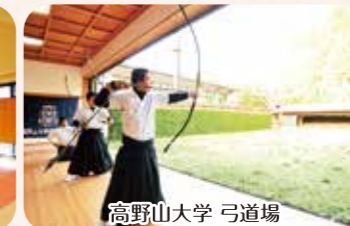
高野山大学 弓道場