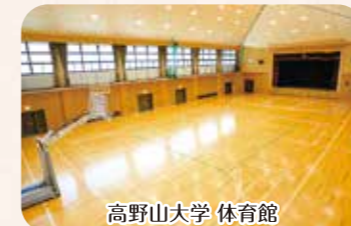
高野山大学 体育館