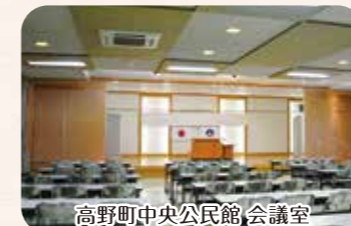
高野町中央公民館 会議室