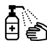
手指消毒用アルコール による消毒の励行

新型コロナワクチンの有効性・安全性などの詳しい情報については、厚生労働省ホームページの「新型コロナワクチンについて」のページをご覧ください。